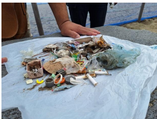
回収したごみ。 量は少ないですが、やはり出てきます。